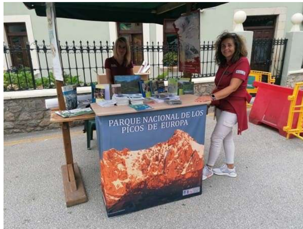
Fotos 26 y 27.- Cartel anunciador del XXXIII Certamen del Queso y la Artesanía de Picos de Europa , patrocinado por el Parque Nacional y puesto del Parque en dicha feria (Panés. Asturias).