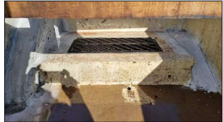
Fotos 19, 20 y 21.- Trabajos de apoyo a la comunidad residente: Nuevo abrevadero en Uberdón (Cangas de Onís. Asturias). Detalles de la rampa húmeda para entrada/salida de anfibios (foto 20) y de la zona húmeda de resguardo para anfibios en fase de agotamiento (foto 21)