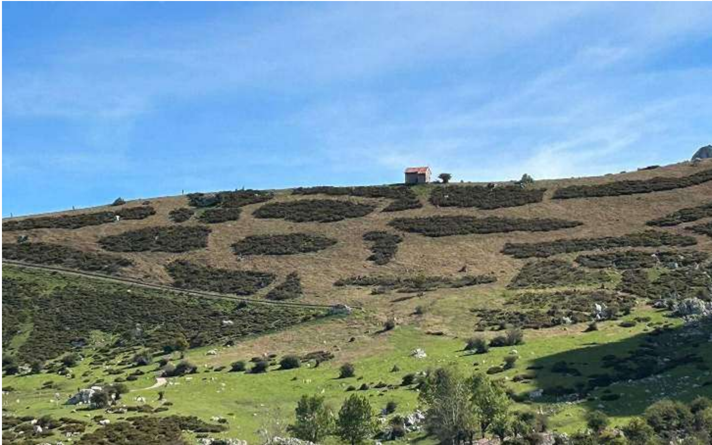
Foto 11.- Desbroces en la cara norte de la Morra de Entrelagos (Cangas de Onís. Asturias). Disposición ajedrezada para limitar los arrastres al Lago Enol.