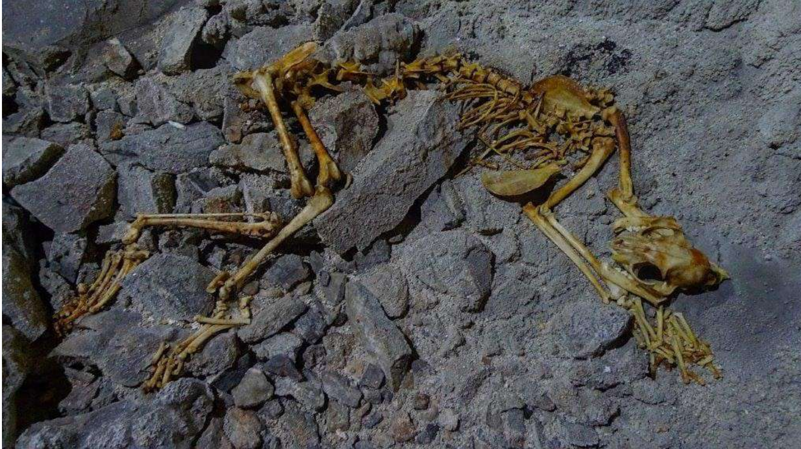
Foto 22.- Extracción de esqueleto de lince boreal ( Lynx lynx ) de la sima de «La Topinoria» (Cillorigo de Liébana. Cantabria).