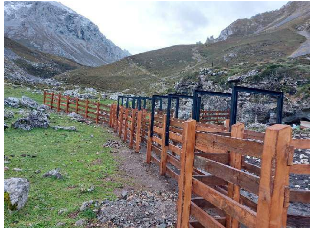
Fotos 17 y 18.- Trabajos de apoyo a la comunidad residente: nuevo potrero en La Caballar y ampliación del potrero de Las Vegas de Sotres (Cabrales. Asturias).