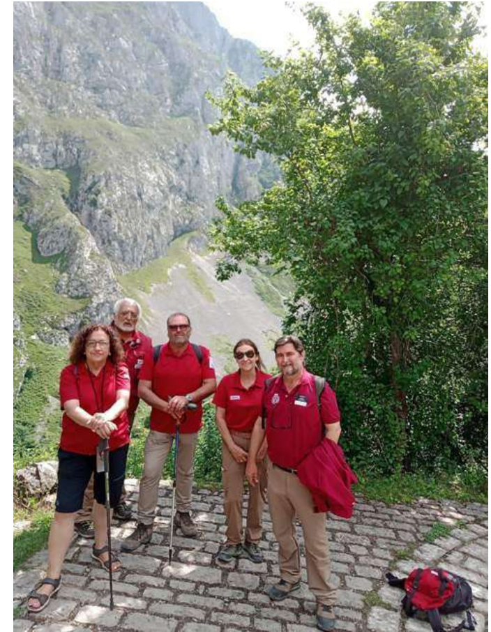
Fotos 30 y 31.- Programa de Intercambios de la Red de Parques Nacionales. Intercambio de Directores (Aigües Tortes i Estany de Santa Maurici, Doñana, Ordesa y Monte Perdido, Picos de Europa y Teide). Izquierda: Chorco de Los Lobos (Posada de Valdeón. León). Derecha: Bulnes (Cabrales. Asturias).