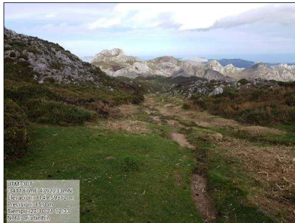
Fotos 03 y 04.- Trabajos de despeje de sendas de interés ganadero y de Uso Público: Belbín-Ario (Onís. Asturias). Antes y después.