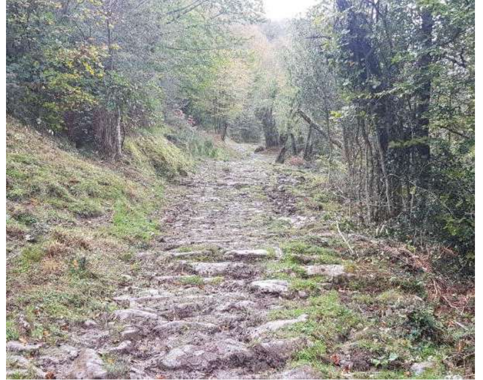
Fotos 05 y 06.- Trabajos de despeje de sendas de interés ganadero y de Uso Público: Senda del Arcediano (Amieva. Asturias). Antes y después