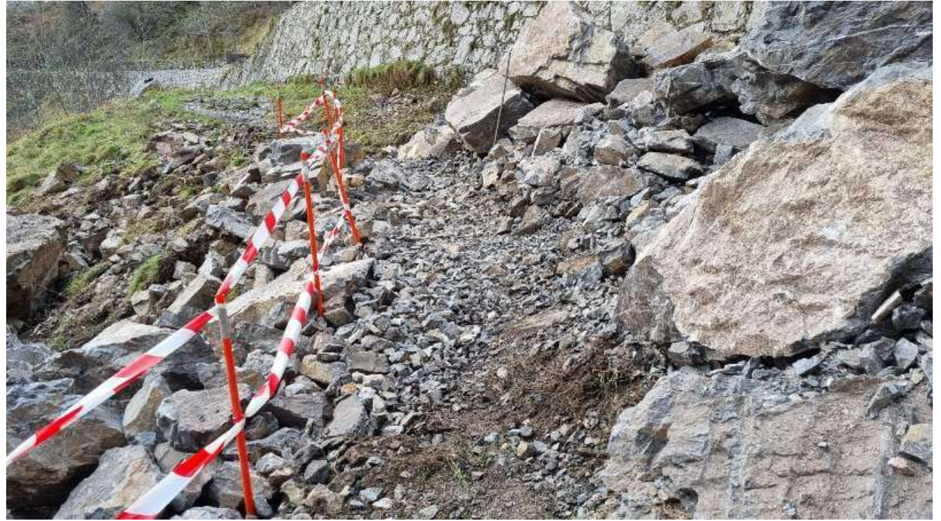
Fotos 13 y 14.- Hundimiento en Culiembro, en la Ruta del Cares (Cabrales. Asturias), marzo 2022. Imágenes del lugar nada más producirse y del establecimiento de paso provisional 24 horas después.