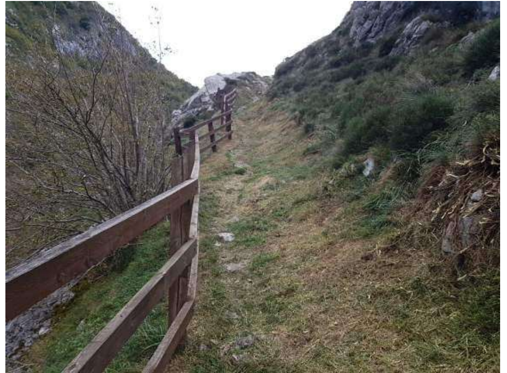
Foto 09 y 10.- Trabajos de despeje de sendas de interés ganadero y de Uso Público: Senda de La Jocica (Amieva. Asturias). Antes y después.