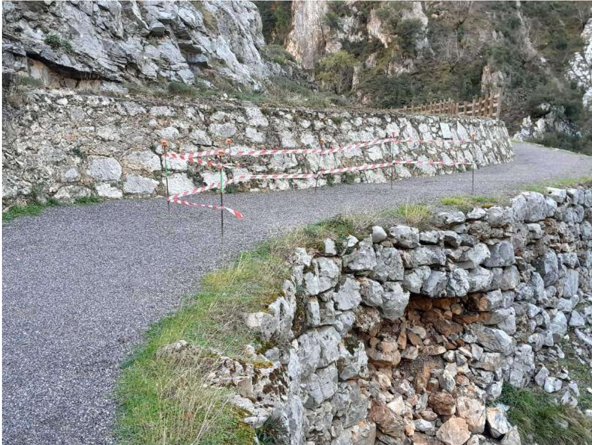
Foto 12.- Hundimiento en El Anchurón, en la Ruta del Cares (Posada de Valdeón. León).