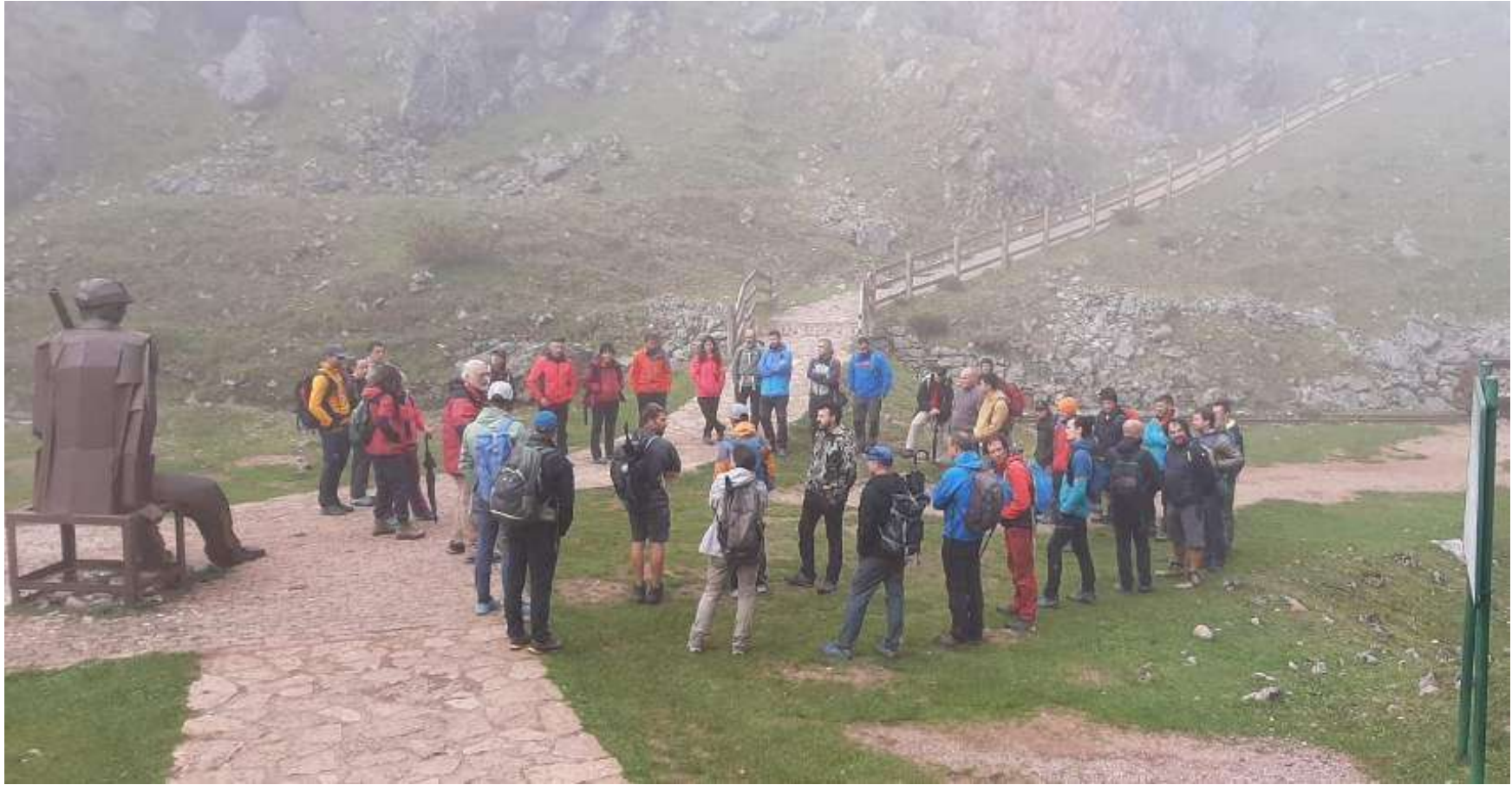
Foto 25.- Curso de Guías de la Red de Parques Nacionales. En el Museo de Sitio de la Mina de Buferrera (Cangas de Onís. Asturias).