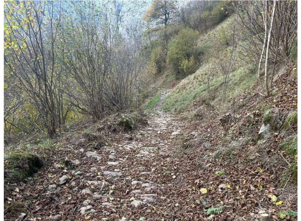
Fotos 07 y 08.- Trabajos de despeje de sendas de interés ganadero y de Uso Público: Bulnes-Pandébano (Cabrales. Asturias). Antes y después.