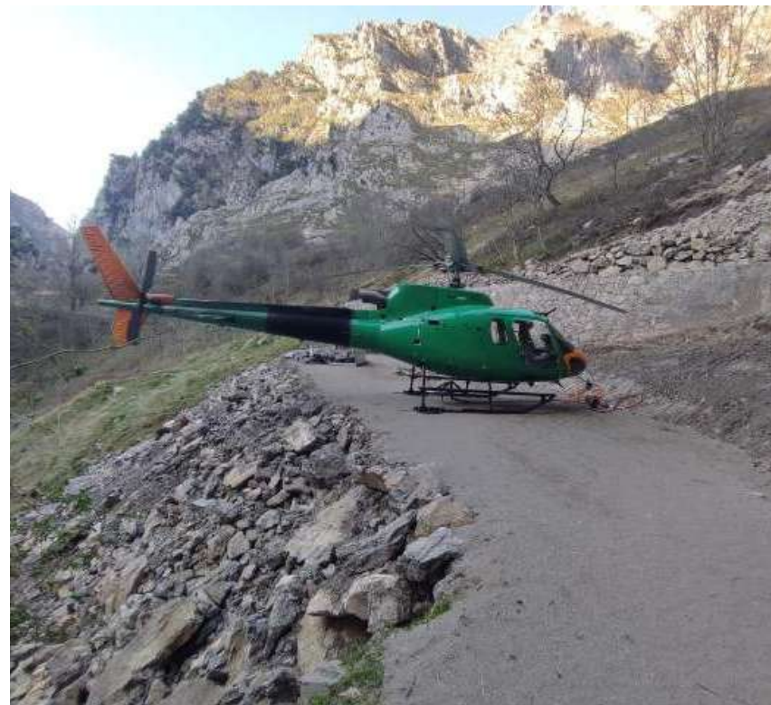
Fotos 15 y 16.- Hundimiento en Culiembro, en la Ruta del Cares (Cabrales. Asturias), Marzo 2022. Labores de remate de la reconstrucción y adecuación de un nuevo punto de toma de helicóptero en la Ruta