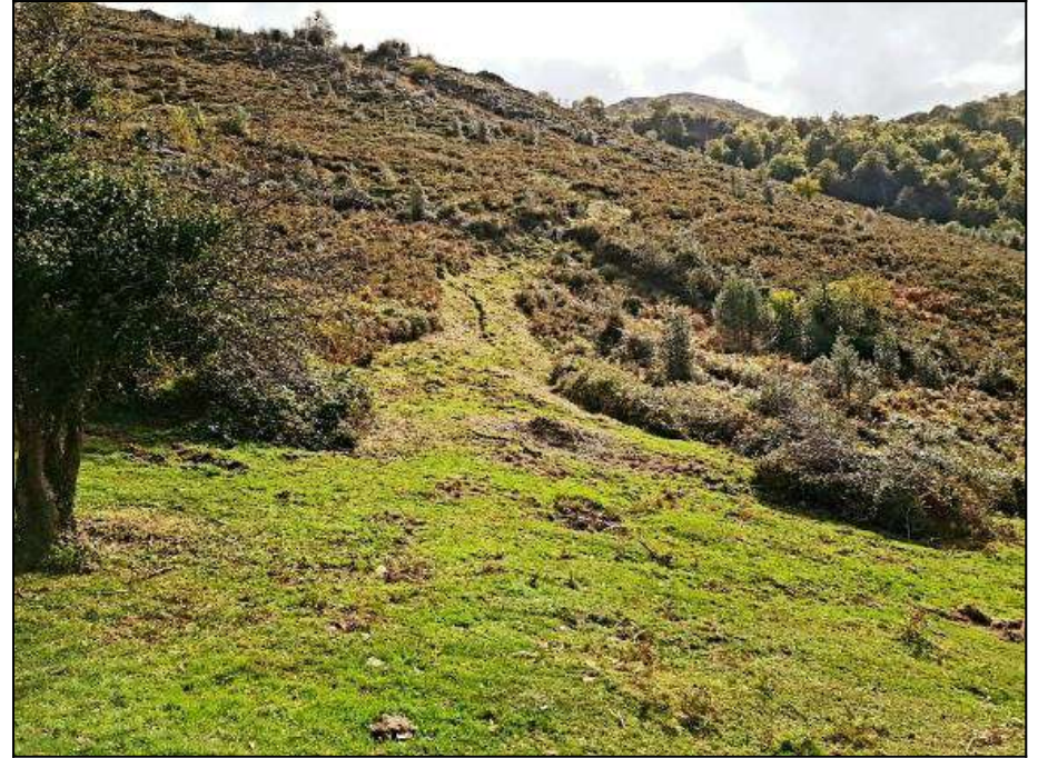
Fotos 01 y 02.- Trabajos de despeje de sendas de interés ganadero y de Uso Público: Orbiandi-Vega La Piedra (Cangas de Onís. Asturias). Antes y después.